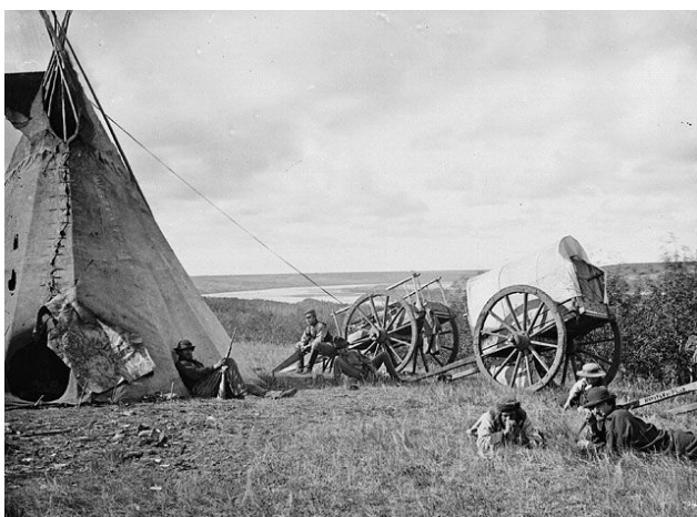
Figure 1 : Photo d'un campement d'arpentage de la société ferroviaire Canadien Pacifique, en 1871

Le Canada s'intéresse aussi beaucoup à la colonie de la Colombie-Britannique parce qu'il a peur de perdre les territoires à l'ouest. À la fin des années 1860, la ruée vers l'or du Cariboo est terminée, et la colonie de la Colombie-Britannique doit régler une énorme dette. Quelques personnes veulent que la colonie fasse partie des États-Unis. En 1869, les Américains construisent un chemin de fer transcontinental offrant ainsi au peuple de l'Ouest la chance de voyager et de transporter leurs produits vers l'est. Vers la fin de l'année 1869, les habitants de la Colombie-Britannique qui veulent encore faire partie des États-Unis font circuler une pétition. Seulement 104 des 10 000 habitants de la colonie acceptent de signer la pétition.