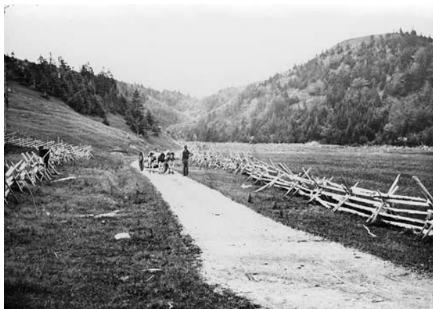
Figure 1 : Photo de la grand route d'Arisaig à Antigonish, en Nouvelle-Écosse

La colonie de l'Île-du-Prince-Édouard refuse de faire partie de la Confédération canadienne parce qu'elle ne veut pas payer pour la construction des chemins de fer sur le continent. Elle décide de construire son propre chemin de fer, mais elle manque d'argent. La dette de la colonie qui s'élève à 250 000 $ en 1863 dépasse 4 000 000 $ dix ans plus tard. Elle consent donc à se joindre au Canada après que celui-ci accepte d'assumer la responsabilité des dettes de construction du chemin de fer, d'acheter les terrains des propriétaires absenteïstes et d'établir des lignes télégraphiques entre l'île et le continent. L'Île-du-Prince-Édouard devient une province du Dominion du Canada le 1 er juillet 1873.