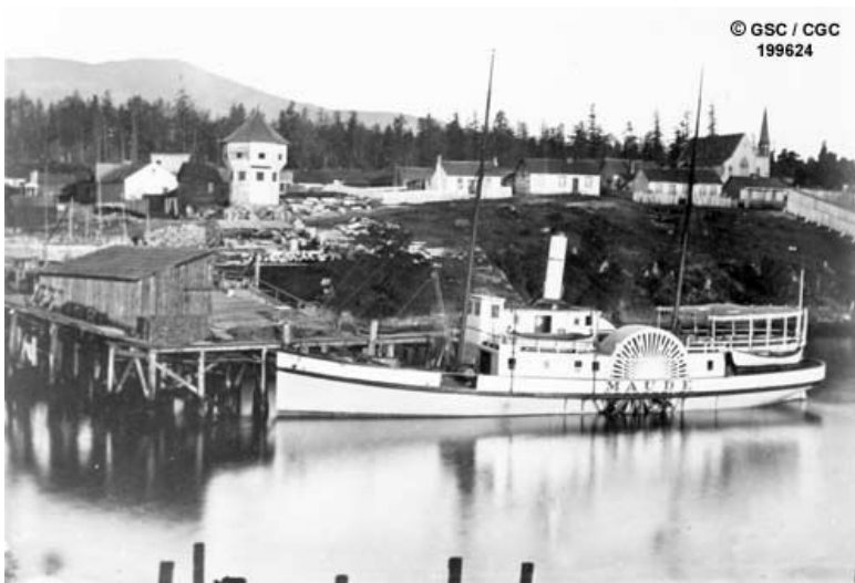
Figure 1 : Photo du vapeur Maude à Nanaimo, en Colombie-Britannique, en 1875. Au cours des années, ce navire a survécu à plusieurs accidents dans les eaux non cartographiées de la côte Ouest. Après sa conversion de bateau à aubes en bateau à hélice, il devint le premier navire à desservir les communautés isolées de l'ouest de l'Île de Vancouver.

En 1870, la frontière ouest de l'Ontario est tracée, et la province du Manitoba est créée. À cette époque, l'Ontario et le Manitoba se querellent beaucoup. En 1874, le gouvernement du Canada établit des frontières provisoires que le parlement de la province doit approuver et qui agrandissent le territoire de l'Ontario vers l'ouest et vers le nord.