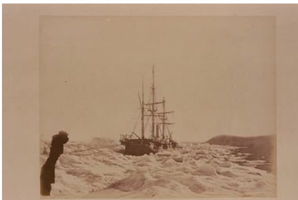
Figure 1 : Photo du bateau Alert à Cape Beechey

Le 7 octobre 1876, une grande partie des Territoires du Nord-Ouest est détachée pour former le District of Keewatin. Ce district devait être temporaire et devait assurer l'administration du territoire situé à l'ouest de l'Ontario et à l'est du Manitoba.