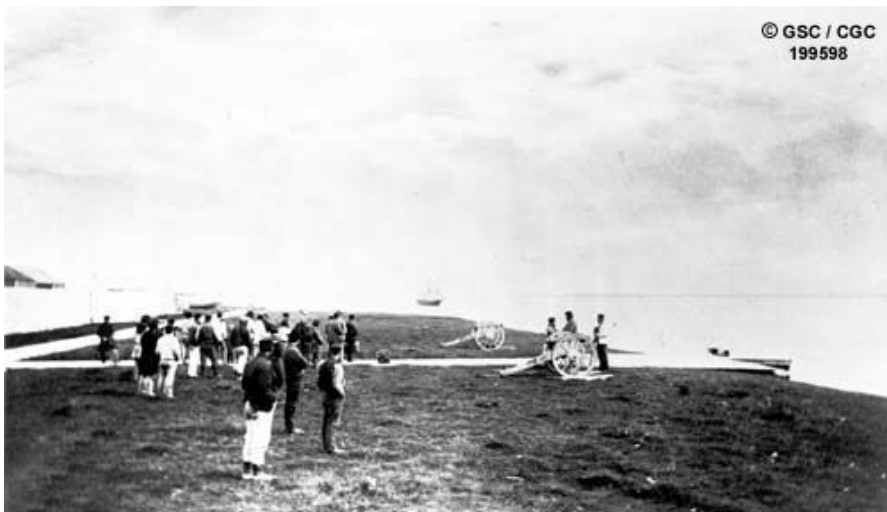
Figure 1 : Photo de l'arrivée du navire ravitailleur annuel à York Factory

Lorsque les Territoires du Nord-Ouest ont été transférés au Canada, ils comprenaient aussi les territoires continentaux dont les eaux s'écoulent dans les océans Arctique et Pacifique. Le 31 juillet 1880, un décret en conseil accorde au Canada tous les autres territoires et possessions britanniques en Amérique du Nord (à l'exception de la colonie de Terre-Neuve) et toutes les îles adjacentes à ces territoires et possessions. Le document donne les îles arctiques au Canada, mais il ne décrit pas le territoire ni ses frontières.