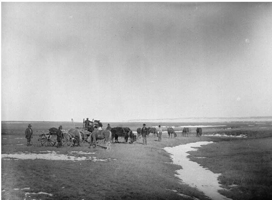
Figure 1 : Photo de l'équipe du géologue Dawson en route pour Benton, en Alberta, octobre 1881