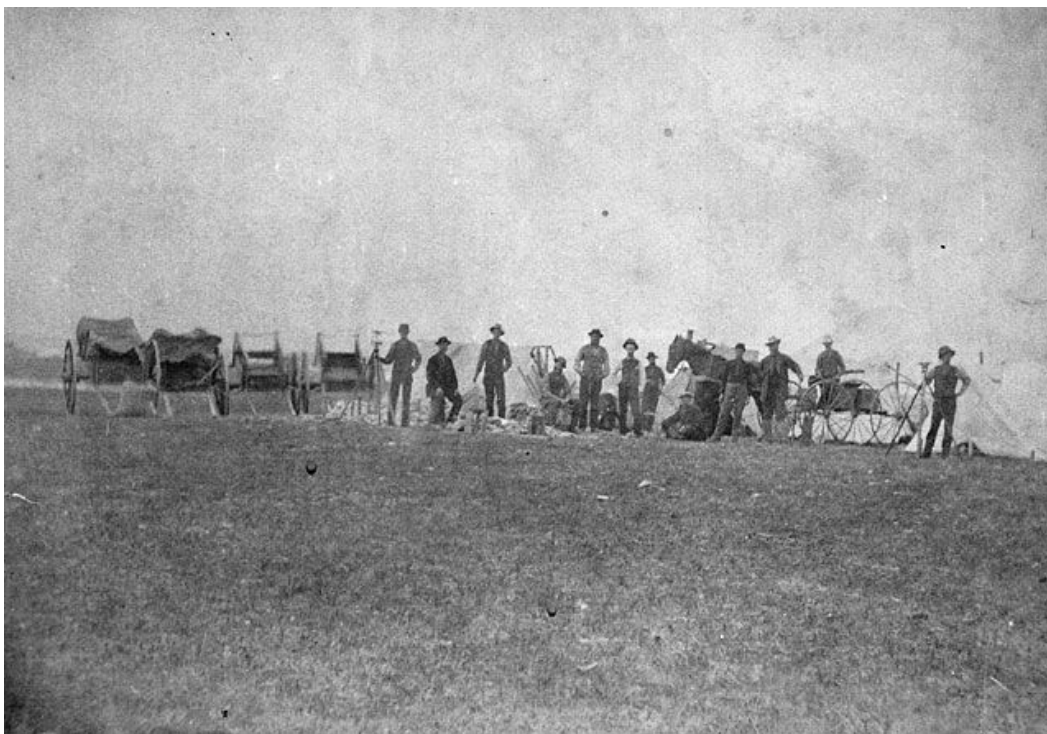
Figure 1 : Photo de Brandon, aux Territoires du Nord-Ouest, campement des arpenteurs