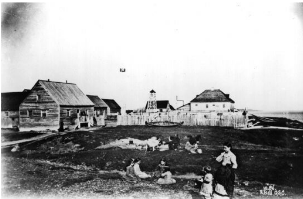
Figure 1 : Photo de Fort Albany, en Ontario

Après sa fuite aux États-Unis en 1870, Louis Riel rentre au Manitoba en 1872. Il gagne une élection partielle et ensuite une élection dans la circonscription électorale de Provencher. Mais parce qu'il n'occupe pas son siège à la Chambre des communes, il est expulsé à vie de la Chambre. En 1875, il est forcé de s'exiler pendant dix ans. En 1884, il accepte l'invitation des Métis du Canada qui veulent qu'il revienne pour devenir leur chef et les aider à conserver leur style de vie.