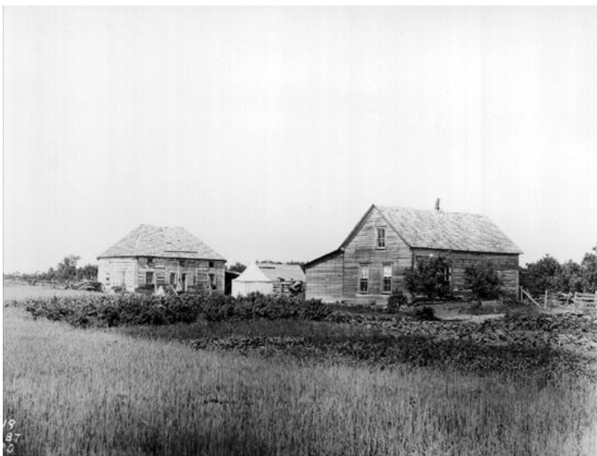
Figure 1 : L'ancien fort de la Compagnie de la Baie d'Hudson à Portage la Prairie

En 1889, la querelle au sujet de la frontière entre le Manitoba et l'Ontario est réglée. On accorde la région contestée à la province de l'Ontario.