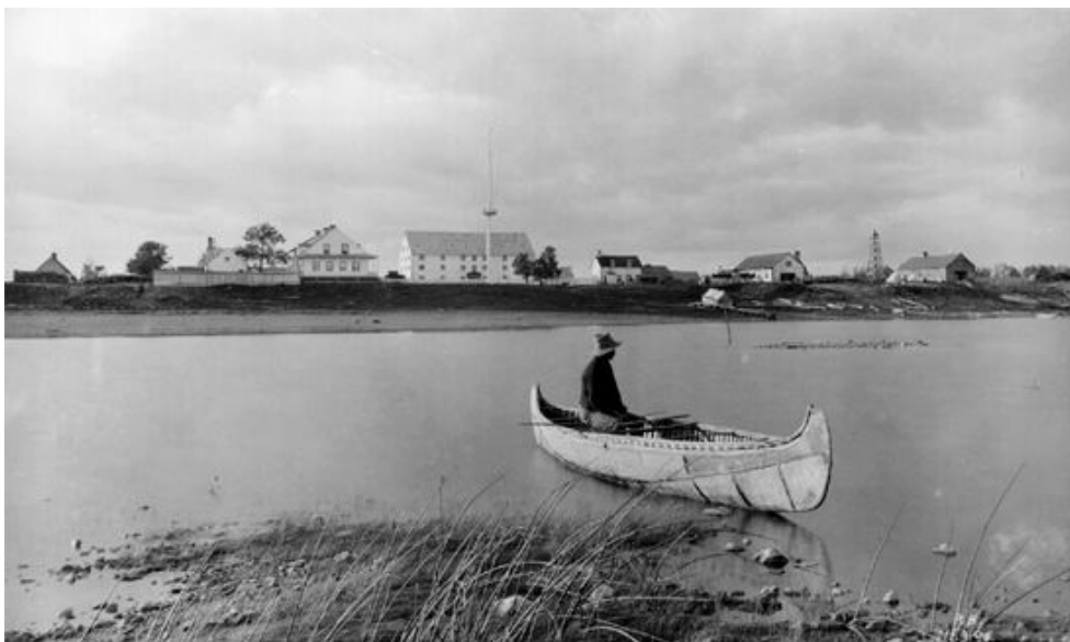
Figure 1 : Le site de Moose Factory

En 1895, l'Acte impérial des frontières des colonies confirme le transfert des terres arctiques au Canada. Quatre nouveaux districts sont créés dans les Territoires du Nord-Ouest et sont nommés Ungava, Mackenzie, Yukon et Franklin. Les districts de l'Athabasca et du Keewatin sont aussi agrandis.