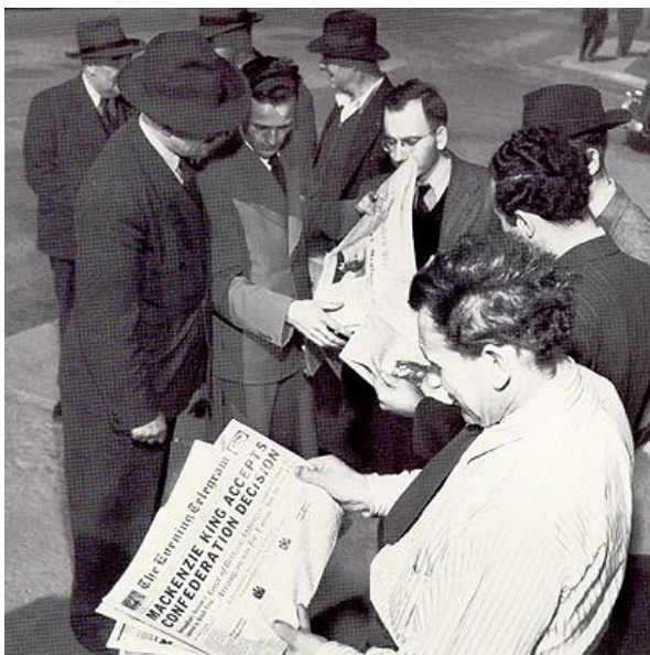
Figure 1 : Photo d'hommes lisant le journal annonçant les résultats du second référendum de Terre-Neuve

La colonie de Terre-Neuve devient la dixième province canadienne en 1949. Ses frontières continentales sont celles qui ont été définies en 1927 pour le Labrador.