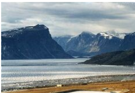
Figure 1 : Photo de Pangnirtung Pass, au Nunavut

C'est le 1 er avril 1999 que le Nunavut est devenu le troisième territoire du Canada. Jamais les frontières intérieures du pays n'avaient été retouchées depuis l'entrée de Terre-Neuve dans la Confédération canadienne, il y a de cela cinquante ans. Découpé à même les Territoires du Nord-Ouest, le Nunavut s'étend sur 2 000 000 kilomètres carrés, ce qui représente grossièrement le cinquième du territoire canadien. Les Territoires du Nord-Ouest ont fait l'objet de plusieurs réductions dans l'histoire du Canada, mais ce nouveau découpage a quelque chose d'unique, parce qu'il résulte de la volonté même des Autochtones qui y habitent. Le Nunavut compte 26 000 résidents, dont quatre-vingt-trois pour cent sont Inuit. Le mot inuktitut, qui le désigne, signifie « Notre terre ».