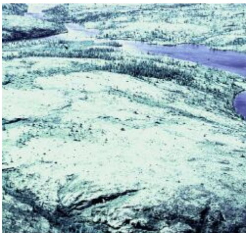
Région dominée par les lichens

Couverts variés où les lichens ont une influence marquée sur la réflectance. Cette classe présente un gradient latitudinal. Dans le nord de la forêt boréale, elle peut correspondre à un couvert résineux de faible à très faible densité et sous-étage de lichens. Au nord de la limite des arbres, cette classe peut englober de nombreuses étendues d'eau. Au nord de la forêt boréale, la réflectance est réduite par la présence des arbres, tandis qu'au nord de la limite des arbres, elle est réduite par la présence des nappes d'eau ou des affleurements rocheux.