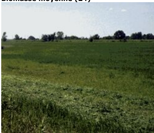
Couverture de biomasse moyenne

Terres cultivées dominées par des cultures de forte biomasse en raison du type de culture (par exemple, le maïs) ou du climat (précipitations adéquates). Cette classe peut englober un faible pourcentage d'autres types de végétation (moins de 10 %).