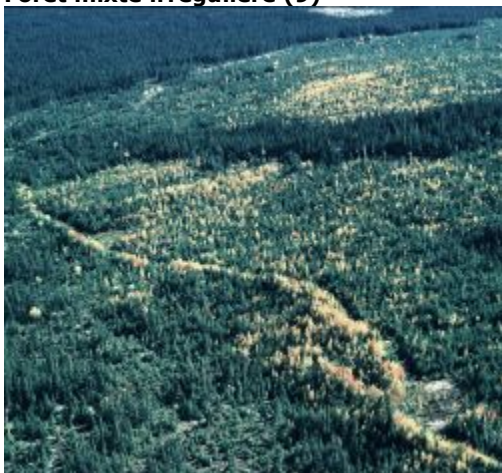
Couverture de la forêt mixte irrégulière

Forêt mixte où les arbres ont une répartition relativement uniforme et où la densité du couvert est généralement élevée.