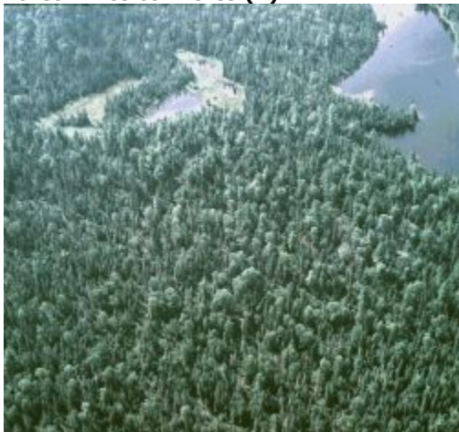
Couverture de la forêt mixte résineuse

Forêt mixte où la proportion de conifères dépasse 60 % (en pourcentage de tous les arbres présents). Cette classe contient parfois une proportion plus élevée de résineux (plus grande que 80 %) lorsque le couvert forestier est plus jeune (la réflectance élevée des jeunes résineux compense la réflectance plus élevée des feuillus dans les peuplements plus âgés).