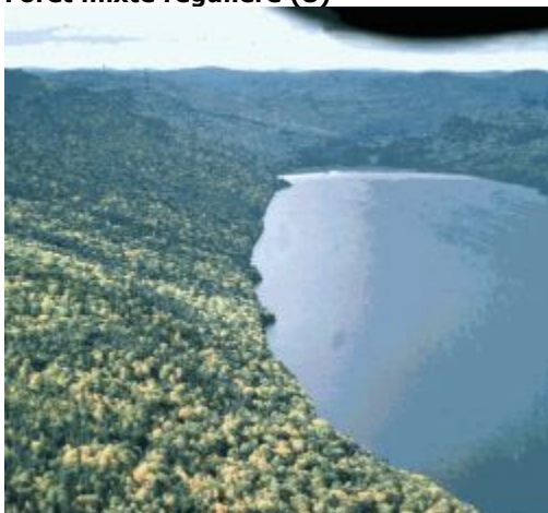
Couverture de la forêt mixte régulière