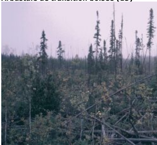
Arbustaie de transition boisée

Territoire où la densité du couvert forestier est habituellement inférieure à 10 %. Cette classe contient nombre de zones anciennement perturbées, surtout par le feu. Elle est principalement localisée dans le nord de la forêt boréale, mais elle se