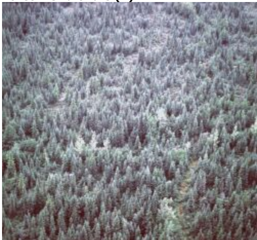
Couverture de la forêt méridionale

Forêt résineuse de densité moyenne qui est souvent adjacente à une forêt de densité plus forte (ci-dessus). Dans la plupart des cas, elle renferme une proportion plus forte de tiges feuillues ou d'arbustes (plantes ligneuses de moins de 2 à 3 mètres de hauteur) que la forêt de densité plus forte. Cette classe, surtout localisée dans le sud de la région forestière boréale, se confond parfois avec un couvert forestier résineux plus jeune et plus dense (la réflectance élevée des jeunes résineux compense celle plus élevée des arbres feuillus dans les peuplements).