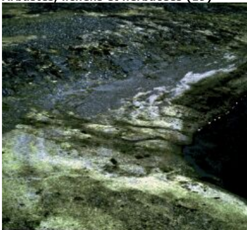
Arbustes, lichens et herbacées

Toundra dominée par les arbustes (surtout éricacées), les lichens et une végétation herbacée. Cette classe est typiquement composée d'arbustes, de lichens et d'herbacées, ainsi que de sol nu et d'affleurements rocheux.