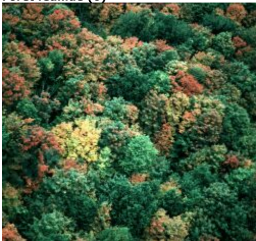
Couverture de la forêt feuillue

Concentration de forêts feuillues ayant généralement une forte densité de couvert. Au Québec et en Ontario, cette classe localise particulièrement les essences feuillues tolérantes (érable, bouleau jaune). En raison de la faible résolution des données AVHRR, la majeure partie de la forêt feuillue établie ailleurs au Canada est englobée dans les classes de forêt mixte (surtout la classe 10).