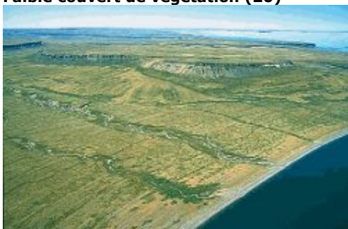
Faible couverture végétale

Toundra où le couvert végétal (arbustes, lichens et plantes herbacées) n'occupe pas plus de 40 % de la surface.