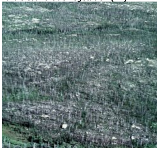
Faible couverture végétale

Zones brûlées probablement au cours des cinq dernières années et occupées par peu de végétation répartie en fonction du site et de l'intensité du feu. Des arbres morts encore sur pied y sont souvent présents.