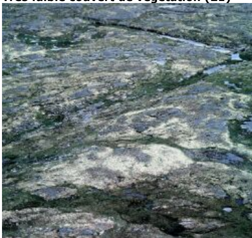
Très faible couverture végétale

Toundra où le couvert végétal (arbustes, lichens et plantes herbacées) n'occupe pas plus de 20 % de la surface.