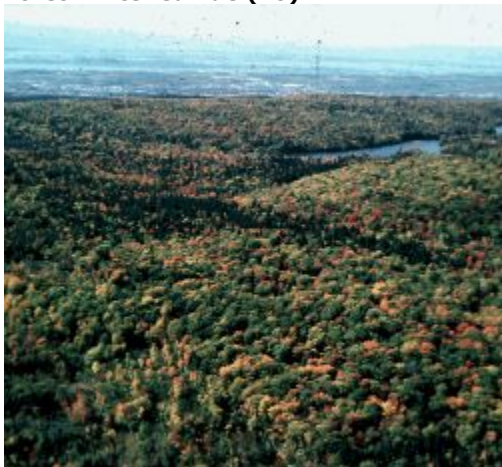
Couverture de la forêt mixte feuillue

Forêt mixte où la densité du couvert est fréquemment plus faible et où les arbres ont une répartition plus inégale dans les peuplements, généralement en raison d'une perturbation ancienne (due à une cause naturelle ou à une intervention humaine). La superficie des îlots peut varier de dizaines à des centaines de mètres. Cette classe contient généralement des couverts plus jeunes.