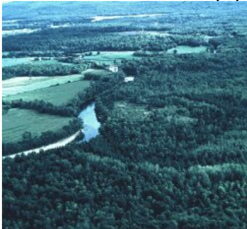
Couverture de zones boisées avec terres cultivées

Mosaïque où les terrains boisés et les arbustes occupent plus de superficie que les terres cultivées. Cette classe est présente dans la région des Prairies où la biomasse est plutôt moyenne.