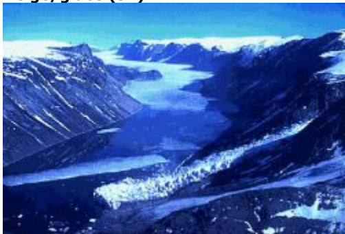
Couverture de neige et de glace

Territoire recouvert en permanence de glace ou de neige.