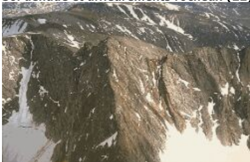
Photo du sol dénudé et d'affleurements rocheux

Toundra où le couvert végétal (arbustes, lichens et plantes herbacées) n'occupe pas plus de 20 % de la surface.