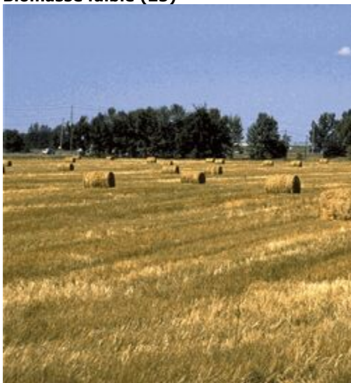
Couverture de biomasse faible

Terres cultivées dominées par des cultures de faible biomasse en raison du type de culture (par exemple, céréales) ou du climat (région semi-aride). Cette classe est présente dans la région des Prairies.