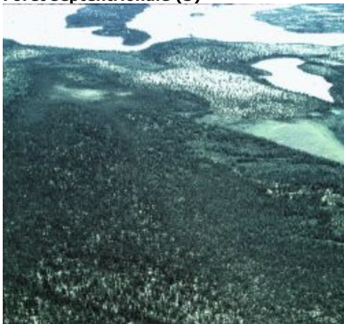
Couverture de la forêt septentrionale

Forêt résineuse de densité moyenne dont le sous-étage est souvent garni d'arbustes et de lichens. Cette classe occupe principalement le nord de la région forestière boréale, mais elle colonise également certains secteurs plus méridionaux, surtout après des perturbations comme des feux.