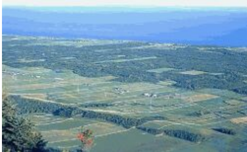
Couverture de zones boisées avec terres cultivées

Mosaïque où les terres cultivées occupent plus de superficie que les terrains boisés. Selon la région, une proportion plus élevée de forêt peut compenser une biomasse plus faible des terres cultivées. Cette classe peut parfois occuper des aires où la végétation herbacée remplace les terres cultivées (par exemple, dans les parcs).