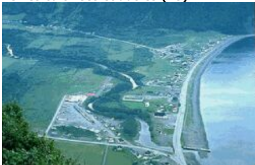
Couverture des terres cultivées et autres

Mosaïque où les terrains boisés et les arbustes occupent plus de superficie que les terres cultivées. Cette classe est présente dans la région des Prairies où la biomasse est plutôt moyenne.