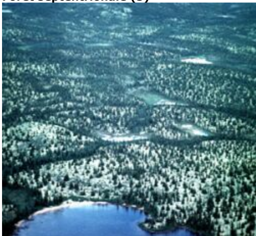
Couverture de la forêt septentrionale