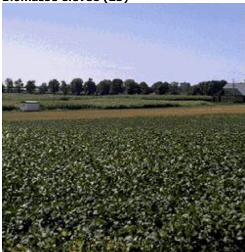
Couverture de biomasse élevée

Terres cultivées dominées par des cultures de forte biomasse en raison du type de culture (par exemple, le maïs) ou du climat (précipitations adéquates). Cette classe peut englober un faible pourcentage d'autres types de végétation (moins de 10 %).