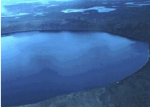
Couverture de l'eau

Territoire recouvert d'eau (à l'état solide ou liquide).