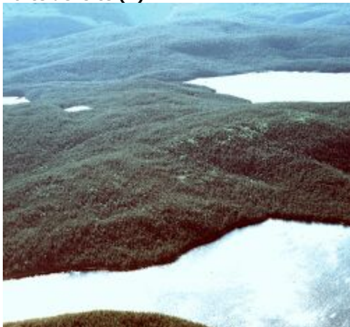
Forêt de conifères : forte densité

Forêt résineuse (sud de la région boréale) dont la densité du couvert est supérieure à environ 60 %. De petites nappes d'eau (lacs) sont souvent présentes. Cette classe contient parfois des peuplements composés de moins de 80 % de résineux (la proportion plus élevée d'eau compense, au niveau spectral, le pourcentage plus élevé de feuillus).