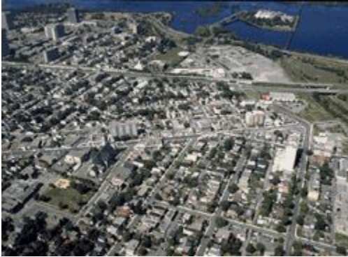
Couverture d'un territoire urbain et bâti

Territoire occupé par des bâtiments et autres constructions. Dans bien des cas, la réponse spectrale de ces territoires est semblable à celle de divers types de couvert sans ou avec peu de végétation. Une autre base de données a donc été utilisée pour localiser les grandes villes. Cependant les agglomérations urbaines plus petites se confondent avec d'autres types de territoire dénudé ou semi-dénudé.