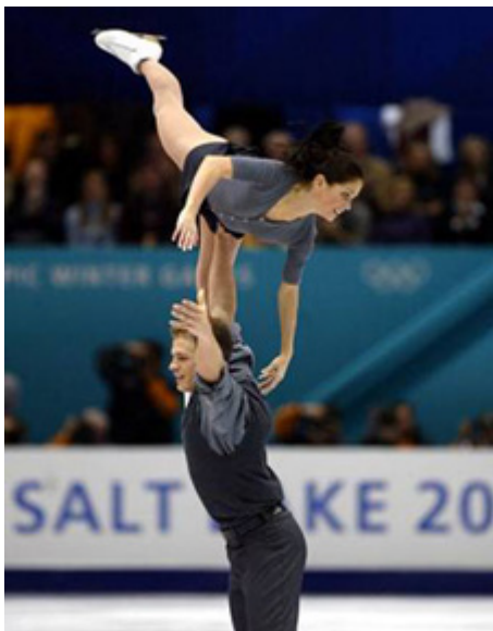
Figure 1 : David Pelletier et Jamie Sale, Olympiques d'hiver de Salt Lake City de 2002

Cette carte montre la distribution des lieux de naissance (lorsque connus) des médaillés des Jeux olympiques d'hiver.