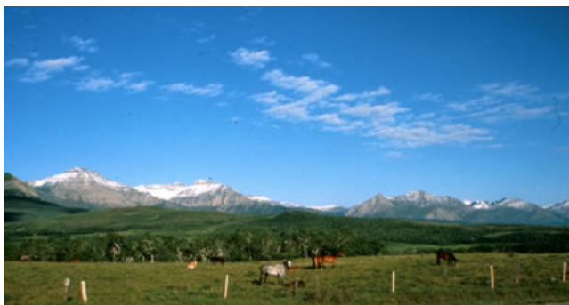
Réserve de la biosphère de Waterton