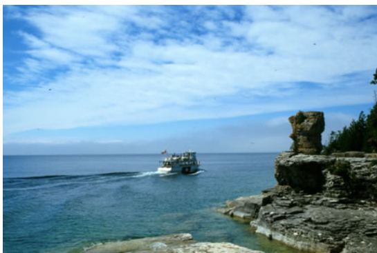
Escarpement du Niagara, baie Georgienne, Ontario